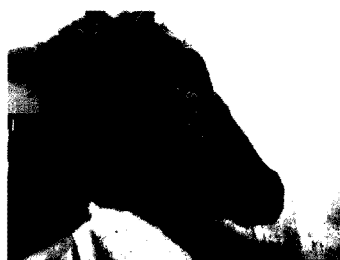
Фигура 1. Слизести изтечения от очите при говедо, болно от заразен нодуларен дерматит